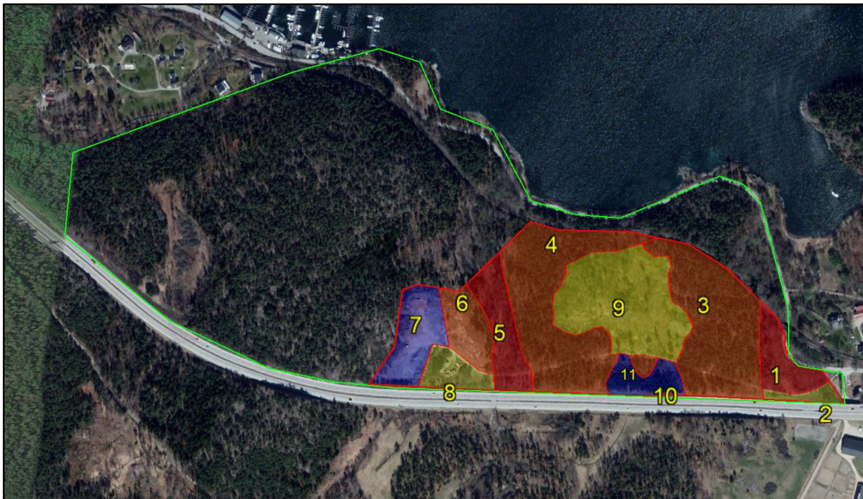
Inventeringsområdet med röd begränsningslinje. Närliggande natur med grön begränsningslinje.